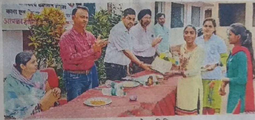
प्रतियोगिता के विजेताओं को पुरस्कृत करते अतिथि।